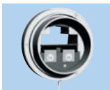
BOAG 20/75 à 45/135 - chaudière 23 kW en cuisine

Fonction V.M.C : Pression 80 et 140 Pa - Débits mini ou maxi : par action chaînette Fonction évacuation des gaz brûlés : - Piloté par bilame : débit 100 m 3 /h