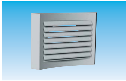
Installation plafond - TMP Ailettes inclinées