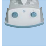
Commandes TL 29