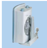
Support mural TL 29