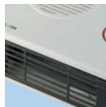
Grille de soufflage TL 10 N