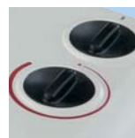
Commandes TL 10 N