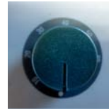
Minuterie TL 29 TW