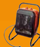
Chauffage industriel et tertiaire

Unelvent • ZI - 66300 Thuir • 04 68 53 02 60