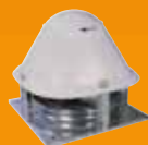
Tertiaire confort et désenfumage