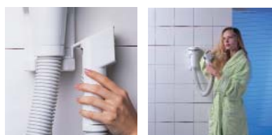
Mise en marche et arrêt automatique par simple décrochage de la buse