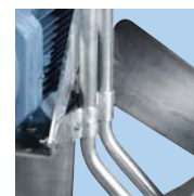
Support moteur aérodynamique