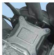
Maintenance aisée trappe de visite virole longue