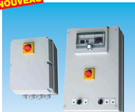
COFFRETS SPECIAUX PARKINGS