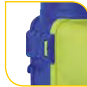
Verrous imperdables et crochets de suspension