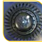
Roue à action Moteur 2 vitesses 230 V - 50 Hz 35 W-Th-C