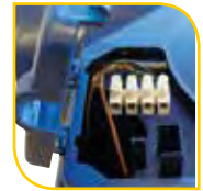
Trappe électrique pour câble ou gaine type ICT 16

Fixation des gaines par double rangée d'ergots