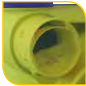
Sanitaires Ø 80 mm 2 x 30 m 3 /h 2 x 15 m 3 /h