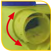
Piquages Ø 80 mm 1/4 de tour