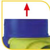
Piquage de rejet Ø 125 mm